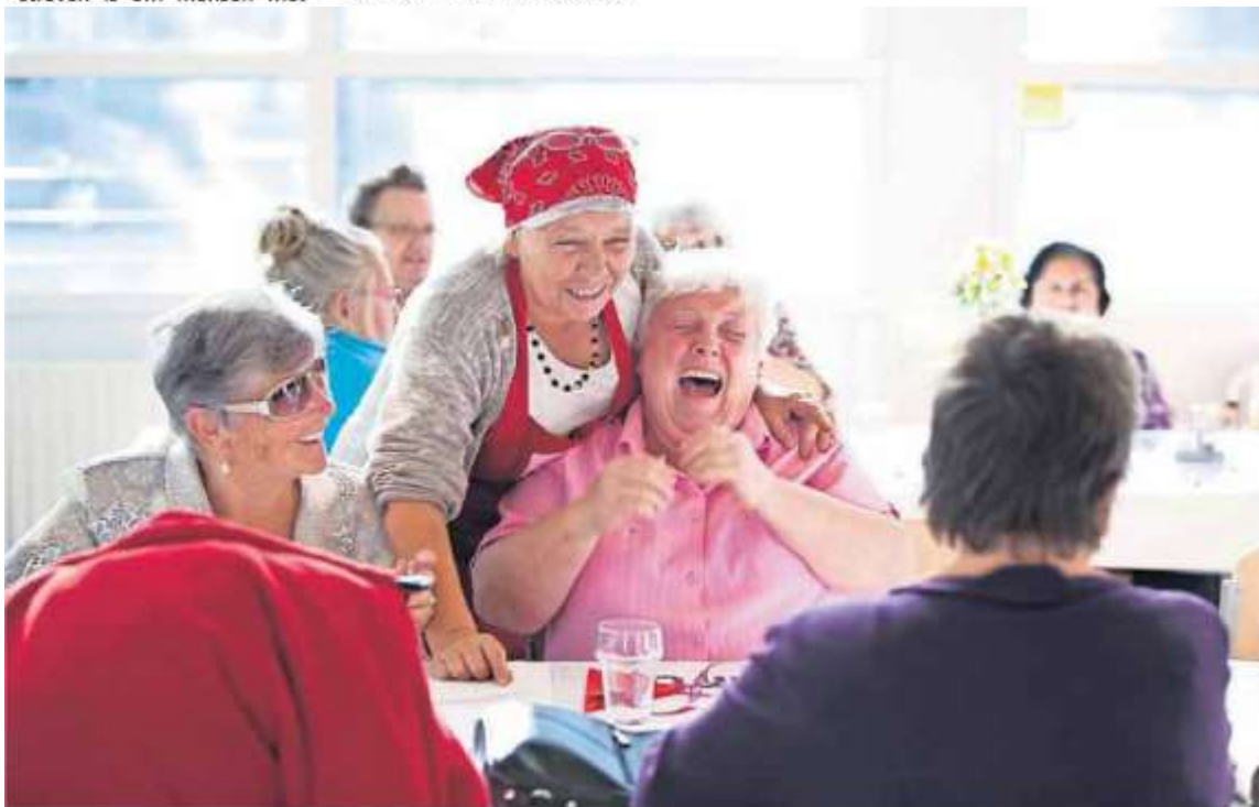
Het Resto is elke woensdag geopend vanaf 17.30 uur in het Kernhuis aan de Parkrand 60.